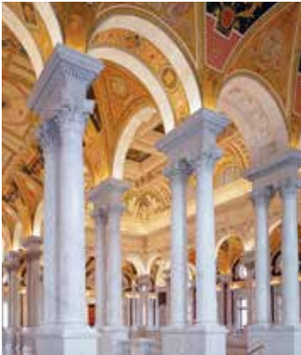
国会图书馆托马斯·杰弗逊大楼主厅