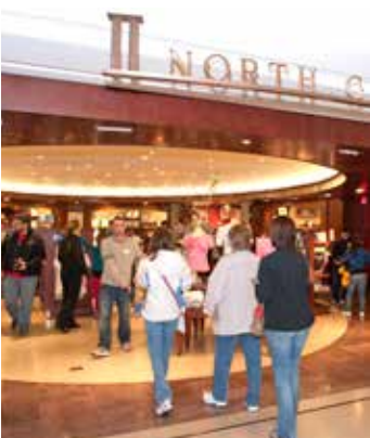
有两个礼品店，位于游客中心上层。

如果确认被禁物品是照顾孩子、医疗或者其他特别需要的物品，美国国会警察有权按照例外情况处理。国会警察可能对包内物品进行检查。