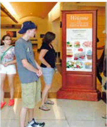
餐厅位于游客中心下层。