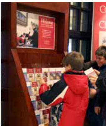
游客中心备有多种外语的游客参观指南。