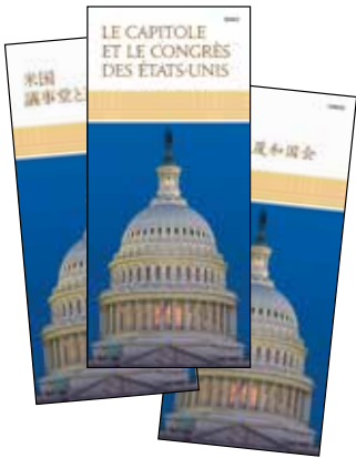
可以从 www.visitthecapitol.gov/brochures 下载多种外语的参观指南的PDF文件。