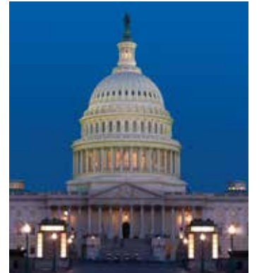
संयुक्त राज्य अमेरिका का संसद भवन

संसद संघीय सरकार की विधायी शाखा है जो अमेरिका के लोगों का प्रतिनिधित्व करती है और राष्ट्र के क़ानून बनाती है। यह कार्यकारी शाखा, जिसका नेतृत्व राष्ट्रपति करता है, और न्यायिक शाखा, जिसका उच्चतम निकाय अमेरिका का सर्वोच्च न्यायालय है, के साथ अधिकार साझा करती है। सरकार की तीन शाखाओं में से, संसद ही एक मात्र वह शाखा है जो सीधे जनता द्वारा चुनी जाती है।