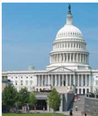
Центр обслуживания посетителей – главный вход в Капитолий США.