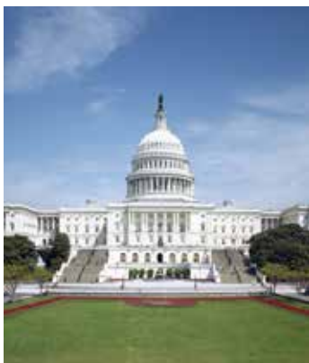
Западный фасад Капитолия выходит на Национальный молл.