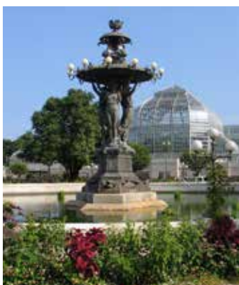
Ботанический сад США