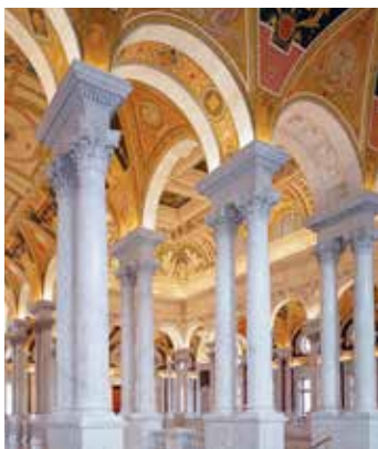
Большой зал джефферсоновского здания Библиотеки Конгресса.