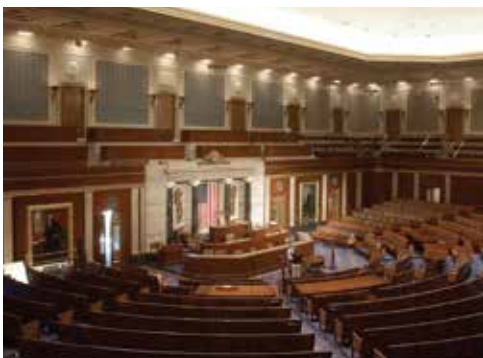
Зал заседаний Палаты представителей