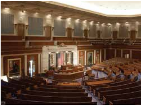
La Cámara de Representantes