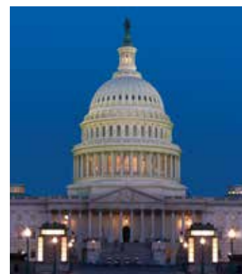
Capitolio de los Estados Unidos

Comparte autoridad con el poder ejecutivo, encabezado por el presidente, y el poder judicial, cuyo máximo órgano es la Corte Suprema de los Estados Unidos. El Congreso es el único poder, de entre los tres poderes del gobierno, que el pueblo elige directamente.