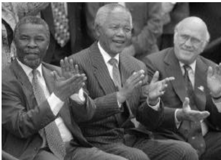
El presidente sudafricano Nelson Mandela, al centro, y los vicepresidentes Thabo Mbeki, a la izquierda, y F.W. de Klerk, a la derecha, celebran la nueva constitución el 8 de mayo de 1996.

formal incluyen la paciencia, especialmente ante la violencia; una voluntad de parte de todos los interesados de dar algunos pasos audaces; y una combinación de negociación en privado en torno a algunos de los temas más difíciles, y una participación pública sin precedentes.