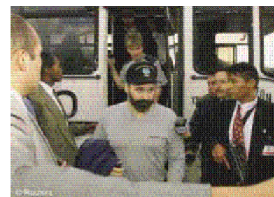
Trabajadores petroleros norteamericanos son liberados el 2 de marzo del 2002 después de ser secuestrados por cuatro meses en la selva ecuatoriana.

partidarios del otro grupo, especialmente en zonas donde competían por los corredores del tráfico de drogas o el terreno de cultivo de coca de primera calidad». De modo similar, las FARC y el ELN «compitieron entre sí para predominar en el bombardeo del oleoducto Caño Limón-Coveñas, combinándose para cometer la cifra sin precedentes de 178 ataques, que tuvieron un efecto ecológico y económico devastador». Otro acontecimiento perturbador ocurrido en Colombia fue la