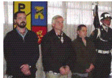
Miembros sospechosos del Ejército Revolucionario Irlandés quienes fueron capturados en el aeropuerto de Bogotá después de un vuelo proveniente de San Vicente del Caguan, una zona desmilitarizada bajo el control de las FARC.

Según el documento, las FARC y las AUC «continuaron con su práctica mortal de masacrar a los