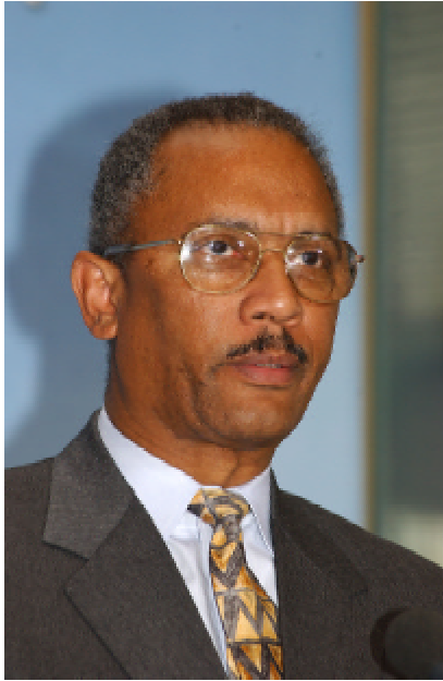
Embajador Frank Taylor, Coordinador Antiterrorismo.

de todos los continentes, culturas y credos, de todas las regiones, razas y religiones, respondieron al llamado del presidente Bush a formar una coalición mundial contra el terrorismo. Estados Unidos dirigió la campaña mundial para destruir la base de al-Qaida en Afganistán y terminar con el régimen opresor de los talibanes que le ofrecían un refugio seguro.