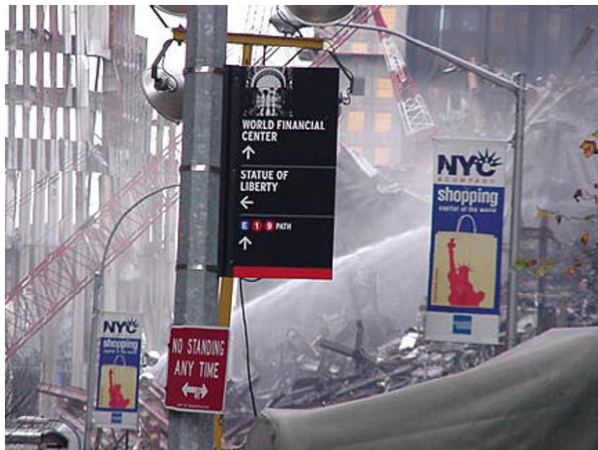
Después de tres meses de ataque al World Trade Center el fuego todavía seguía encendido en el Punto Cero.

Unidos, señala el informe «Tendencias del Terrorismo Mundial: 2001». En comparación, en el año 2000 perecieron 409 personas en ataques terroristas internacionales. Sólo en la ciudad de Nueva York murieron ciudadanos de 78 países a causa de los ataques terroristas contra las Torres del Centro Mundial de Comercio, dijo el informe.