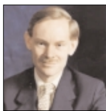
ROBERT B. ZOELICK Representante Comercial de EE.UU.