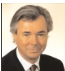
PIERRE S. PETTIGREW Ministro de Comercio Internacional de Canadá