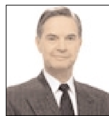
LUIS ERNESTO DERBEZ Secretario de Economía de México