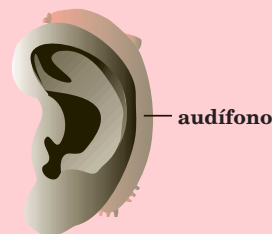
Detrás del Oído

rior del oído. Los alambres no se pueden ver porque están dentro del audífono. Son ideales para los casos entre suaves a moderados.