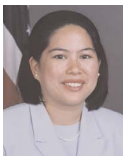
Mme Celina Realuyo est à la tête des programmes de lutte contre le

Le gouvernement des États-Unis aide ses alliés étrangers à renforcer leurs capacités afin qu'ils puissent empêcher les terroristes d'exploiter le système financier international. À cet égard, le groupe de travail interministériel sur le financement du terrorisme identifie les pays qui ont le plus besoin de l'aide des États-Unis en matière de formation et sur le plan technique. Pour faire pièce au terrorisme, chaque État doit se doter du cadre juridique, de la réglementation bancaire, d'une cellule de renseignements financiers, d'organes de répression et de la procédure judiciaire qui s'imposent. Les États-Unis fournissent ce type d'assistance à des pays d'Afrique, d'Amérique latine, d'Asie, d'Europe et du Moyen-Orient, et ils agissent en coopération avec des organisations régionales et des institutions financières internationales.