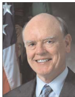
John Snow Ministre des finances des États-Unis

Les mesures visant à désorganiser les circuits financiers du terrorisme et à les démanteler sont appliquées sans relâche et vont se poursuivre. Nous ne reviendrons pas sur notre décision de découvrir les commanditaires du terrorisme et de mettre fin à leur action. Le présent numéro de «Perspectives économiques» montre dans quelle mesure les États-Unis et leurs alliés dans le monde entier continuent de se servir de leur pouvoir, de leurs relations et de leur savoir-faire pour s'attaquer aux sources, aux circuits et aux avoirs des commanditaires du terrorisme.