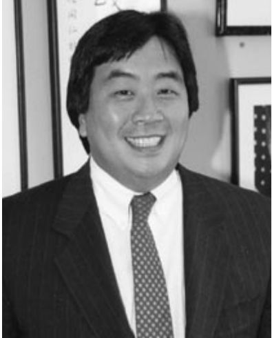
Harold Hongju Koh

peuple, même lorsqu'ils plaident en faveur de réformes économiques et politiques susceptibles de se révéler préjudiciables à la population, ne serait-ce que temporairement.