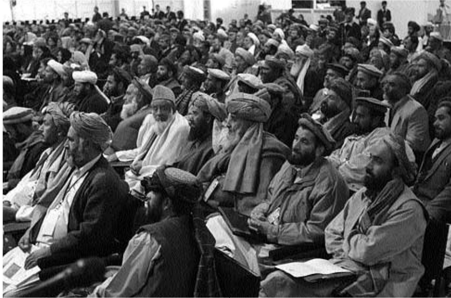
Участники афганской лойя-джирги (большого совета) слушают выступления делегатов на второй день заседаний, 15 декабря 2003 года, в Кабуле (Афганистан). Афганские старейшины собрались в Кабуле, чтобы разработать проект Конституции страны.

ре утверждают, что традиции ислама и демократия не являются несовместимыми и что можно сделать так, чтобы они работали вместе.