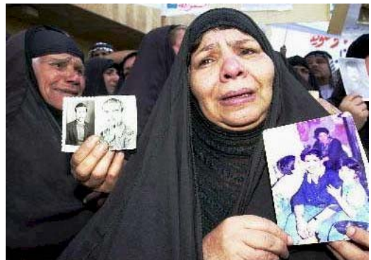
Những người phụ nữ Iraq biểu tình trước cổng Bộ Ngoại giao ở Bát-đa, yêu cầu được biết thông tin về thân nhân của họ đã bị mất tích từ cuộc Chiến tranh vịnh Vịnh.

"Nếu bạn bị bắt, cuộc đời bạn coi như kết thúc". -- "Ahmed," một người dân Iraq dấu tên nói với phóng viên Cameron W. Barr của tờ Người Hướng dẫn Khoa học đạo Thiên chúa (31/10/2002).