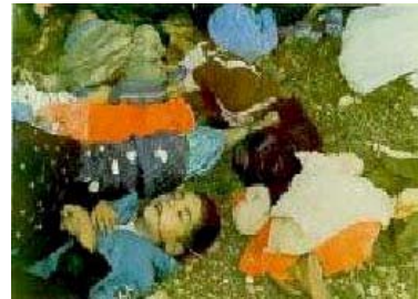
Những đứa trẻ Iraq là nạn nhân của các cuộc tấn công bằng vũ khí hóa học của Saddam

Hành quyết tập thể ở Iraq được thực hiện dưới nhiều hình thức độc ác. Một phương pháp nhanh nhưng hiệu quả là xếp hàng ngang toàn bộ đàn ông của một làng và bắn chết họ để tiêu diệt làng đó. Tuy nhiên, chế độ Saddam Hussein thường thích những phương pháp mất thời gian nhiều hơn và gây đau đớn nhiều hơn cho nạn nhân và gia đình họ. Chế độ của ông ta đã dùng khí độc đối với các tù nhân chính trị bằng cách cho họ thở khí độc có tác dụng chậm như thallium, loại chất độc này dần thâm nhập vào cơ thể và nạn nhân sẽ chết sau vài ngày. Các công dân Iraq thường bị chặt đầu trước sự chứng kiến của gia đình và trong những trường khác, họ bị bắn chết trước mắt gia đình họ và gia đình họ bị buộc phải trả tiền đạ. Saddam Hussein đã hoàn thiện nhiều phương pháp giết hại người Kuốc ở miền Bắc Iraq và các lãnh tụ tôn giáo Shi'a, khi cho rằng họ không trung thành với chính phủ. Sau khi bị giết, nhiều người Iraq bị chôn trong các nấm mồ vô danh để gia đình họ không thể đến thăm viếng.