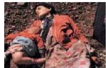
Một bà mẹ và đứa con bị ngạt hơi độc ở Halabjah.

Saddam Hussein đã trở thành lãnh tụ đầu tiên trên thế giới sử dụng khí độc có hệ thống và hung ác đối với chính người dân của ông ta. Trong khoảng từ năm 1983 đến 1988, ông ta đã giết hại hơn 30.000 người Iraq bằng hơi độc và chất độc gây rối loạn thần kinh. Nhiều tổ chức quốc tế cho rằng ông ta đã giết hơn 60.000 người Iraq bằng hoá chất, bao gồm nhiều phụ nữ và trẻ em. Trong hai năm tiến hành chiến dịch Anfal chống lại người Kurd, Saddam