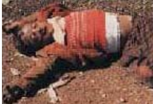
Một cậu bé người Kuốc bị chết bởi vũ khí hóa học

Lúc đó là 6 giờ 20' tối ngày 16/3/1988, khi mùi tảo tràn vào thị trấn Halabja có số dân 80.000 người của người Kuốc ở Iraq. Thị trấn này ngay lập tức chìm trong màn khói dày đặc vì hoá chất thấm đẫm quần áo, miệng, phổi, mắt và da của những thường dân vô tội. Trong ba ngày, máy bay của không quân Iraq thả hơi độc, chất làm rối loạn thần kinh như sarin và tabun, và VX, một loại khí mới được sản xuất và có khả năng gây chết người cao.