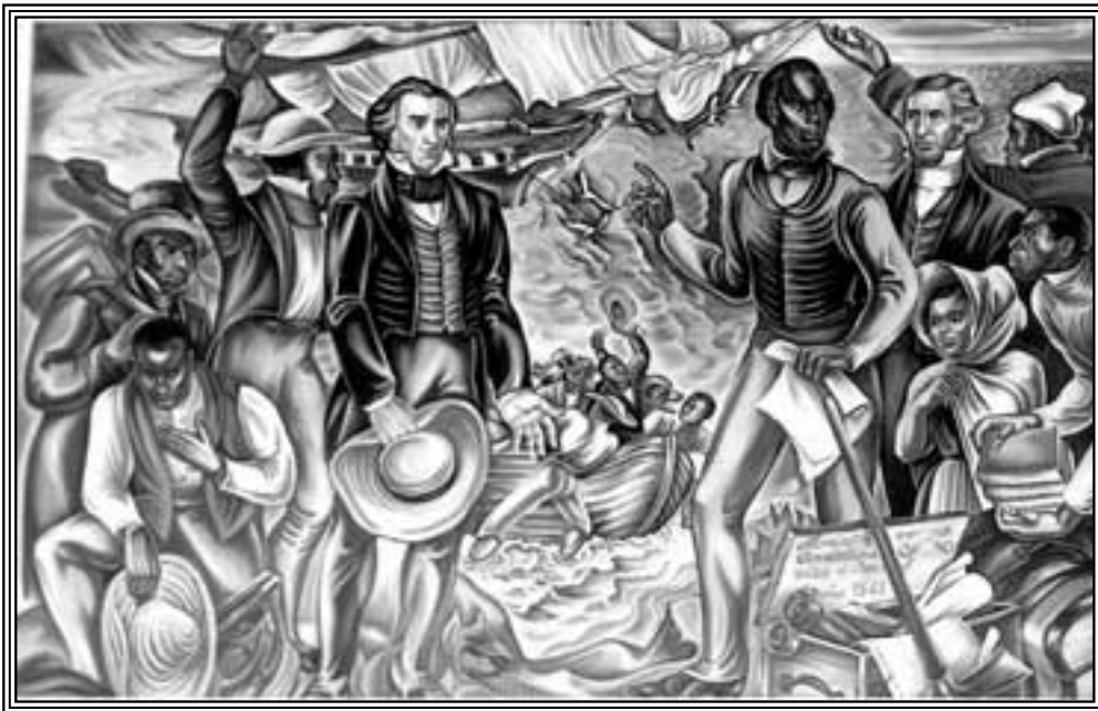
Los del Amistad regresan a Sierra Leona en 1842. En este cuadro de Hale Woodruff, Sengbe Pieh aparece en primer plano con tres misioneros americanos. La barca Gentleman está en el fondo.