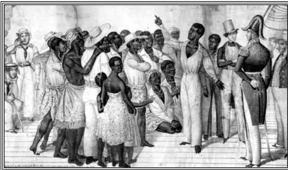
Sengbe Pieh y los del Amistad al momento de su captura en 1839. Los Africanos habían sido secuestrados en su mayoría de la zona de la Colonia de Sierra Leona y vendidos a esclavistas Españoles.

Cinques no es pirata, ni asesino, ni delincuente. El homicidio que cometió es justificable. De haberlo hecho un blanco, habría sido glorioso. Lo habría inmortalizado. Joseph Cinques no debe ser enjuiciado. Todos saben que