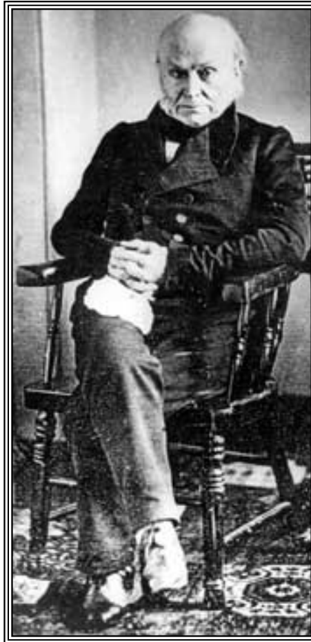
John Quincy Adams, de 73 años de edad y ex-Presidente de los Estados Unidos, salió de su retiro para hablar en favor de los "Amistades" ante la Suprema Corte de Justicia de los Estados Unidos.

El Comité Amistad comprendía que necesitaba una figura pública de la más alta jerarquía para que planteara la causa de los cautivos africanos ante el Tribunal Supremo de Estados Unidos. Los abolicionistas per-