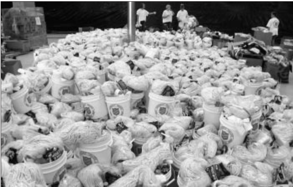
Un mar de trapeadores espera a los dueños en un centro de distribución en Wilson.