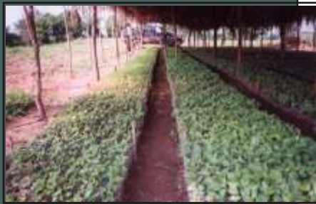
Cultivos de ají en Córdoba, parte de los programas de desarrollo alternativo.

El Programa de Desarrollo Alternativo ayudó a 368 campesinos del departamento del Huila a sustituir sus cultivos de amapola por cultivos de maracuyá. A través del contratista, la USAID ofreció asistencia técnica a los campesinos para familiarizarlos con el nuevo cultivo y ayudarles en el mercadeo. Para esto, la USAID ayudó a establecer una relación entre la cooperativa de campesinos cultivadores y el mercado de bienes agrícolas. Con esto, se establecieron contratos a futuro con tres grandes compañías de jugos que accedieron a comprar la totalidad de los cultivos. Como resultado, los campesinos recibirán US $200 mensuales, un salario que les permitirá vivir sin necesidad de volver a sembrar cultivos ilícitos. Esta es la primera vez en la historia del mercado de bienes agrícolas que un mercado a futuro de este tipo se ha establecido.