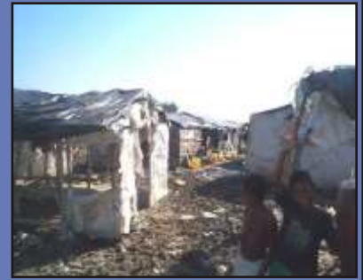
Situación anterior de las familias desplazadas en el barrio Playa Blanca.

Antes de la llegada de la USAID, 100 familias desplazadas que vivían en Cartagena se ganaban la vida vendiendo butifarra. Cuando la USAID visitó por primera vez el lugar donde vivían se asombraron de las deplorables condiciones sanitarias e higiénicas. A través del contratista de la USAID pronto se diseñaron programas de microcrédito y entrenamiento que permitió que estas familias pudieran expandir su negocio. Al mismo tiempo, con apoyo del gobierno municipal, se logró la reubicación de 29 familias a otras comunidades. A través de otro contratistas se establecieron viviendas temporales con acceso a servicios de agua y baños públicos. Gracias a la cooperación entre varias instituciones se lograron solucionar las necesidades básicas de la comunidad. La situación de pobreza y las graves condiciones sanitarias se transformaron en un ambiente seguro y sano para estas familias.