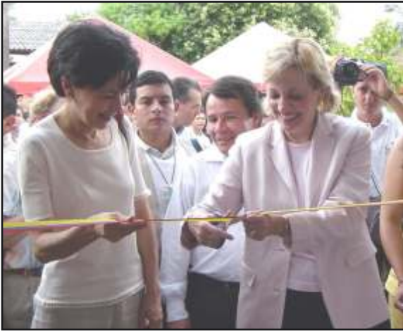
La Embajadora de Estados Unidos, Anne W. Patterson, y la Primera Dama de la Nación, Lina de Uribe, inauguraron el Centro de Convivencia Ciudadana en Barrancabermeja el pasado 19 de diciembre de 2003.

El pasado 19 de diciembre de 2002 se inauguró en Barrancabermeja el primer Centro de Convivencia Ciudadana. Este centro es el resultado del apoyo del gobierno de Estados Unidos a Colombia, particularmente en diversos proyectos de desarrollo social. Uno de los principales renglones de esta cooperación se hace a través de la Agencia para el Desarrollo Internacional (USAID) para el fortalecimiento de la justicia en Colombia. Tanto El Programa Nacional de Casas de Justicia y Paz, como iniciativas específicas de paz con entidades gubernamentales y no gubernamentales, cubren los más diversos campos del quehacer comunitario.