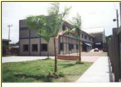
Casa de Justicia y Paz en Cartagena

Dentro del programa de apoyo a la administración de justicia se han obtenido resultados importantes como la construcción de tres Casas de Justicia y Paz adicionales que han permitido atender a 1'402.489 personas de sectores marginados de Colombia. La mayoría de los casos atendidos se refieren a casos de violencia intrafamiliar. Las mujeres representan el sector más beneficiado por este programa.