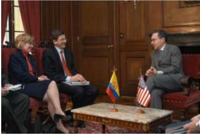
El presidente Alvaro Uribe recibió la visita del subsecretario de Estado para Asuntos Políticos Marc Grossman el 5 de marzo de 2003. En la fotografía los acompaña la Embajadora Anne W. Patterson.