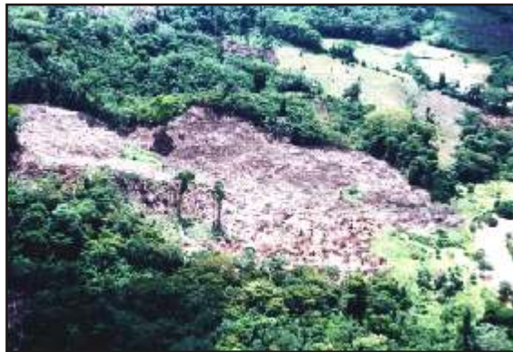
Muestra de la tala de selva tropical para la siembra de cultivos ilícitos.

Los ciudadanos de bien necesitan pensar en esto la próxima vez que ellos y sus amigos se reúnen para decidir cómo detener el calentamiento mundial y cómo salvar los bosques tropicales del planeta. Los verdaderamente preocupados ciudadanos también deben pensar en esto la próxima vez que decidan inhalar cocaína o usar heroína, aunque sea sólo "por diversión". Sus organismos no serán lo único que contaminen.