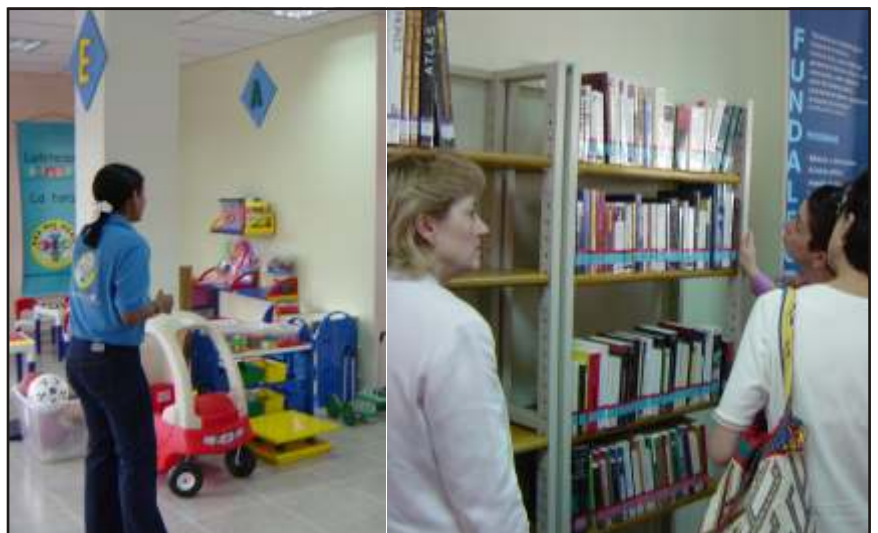
Imágenes del Centro de Convivencia Ciudadana y ludoteca inauguradas el 19 de diciembre de 2002 en Barrancabermeja con el apoyo de la Agencia para el Desarrollo Internacional (USAID) del gobierno de Estados Unidos.

El gobierno de Estados Unidos apoya con satisfacción proyectos como éste, el cual tiende a prevenir los factores que generan conflicto en la comunidad y a promover soluciones alternativas y eficaces que eviten la escalada de dichos conflictos.