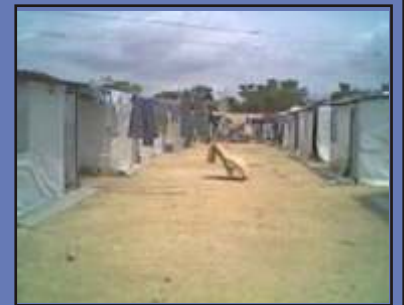
Barrio El Pozón con viviendas temporales donde fueron reubicadas las familias desplazadas.