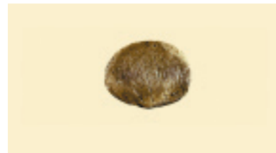
严重田间/天气 损坏粒 (灰/黑)