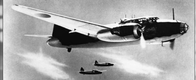
Mitsubishi G4M medium bombers, Allied codename "Betty," early 1940s. 1940年代初期の三菱G4M 1式陸上攻撃機、連合国軍暗号名「ベティ」

米軍兵士はこの貯蔵庫とアスリート飛行場の構造を修理し、後にイスレイ飛行場と呼ばれる新しいB-29爆撃機の航空基地となった。