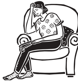
Cuando se presentan los síntomas, estos son como los de una gripe común (catarro)

Cuando el hígado se deteriora trata de repararse a sí mismo formando pequeñas cicatrices por medio de un proceso denominado fibrosis. Una mayor cantidad de fibrosis pueden indicar un mayor avance y gravedad de la enfermedad.